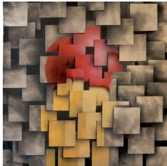
Serie - Meter für Meter Maße: 100 x 100cm Acryl, Aerosol auf Leinen, 2013